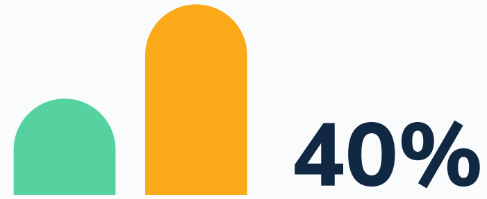
Verringerung des Kundenzeitwerts

Foleon entwickelte ein ausgeklügeltes und leicht nachvollziehbares Nutzererlebnis für seine Kunden und konnte so die Konversionsrate von der Testversion zur zahlungspflichtigen Version erheblich steigern.